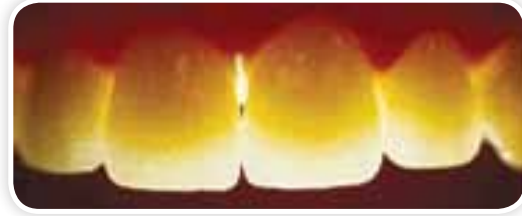
Metal desteksiz zirkonyum kuron görüntüsü (Güneş ışığında %100 doğal diş görüntüsü verir)