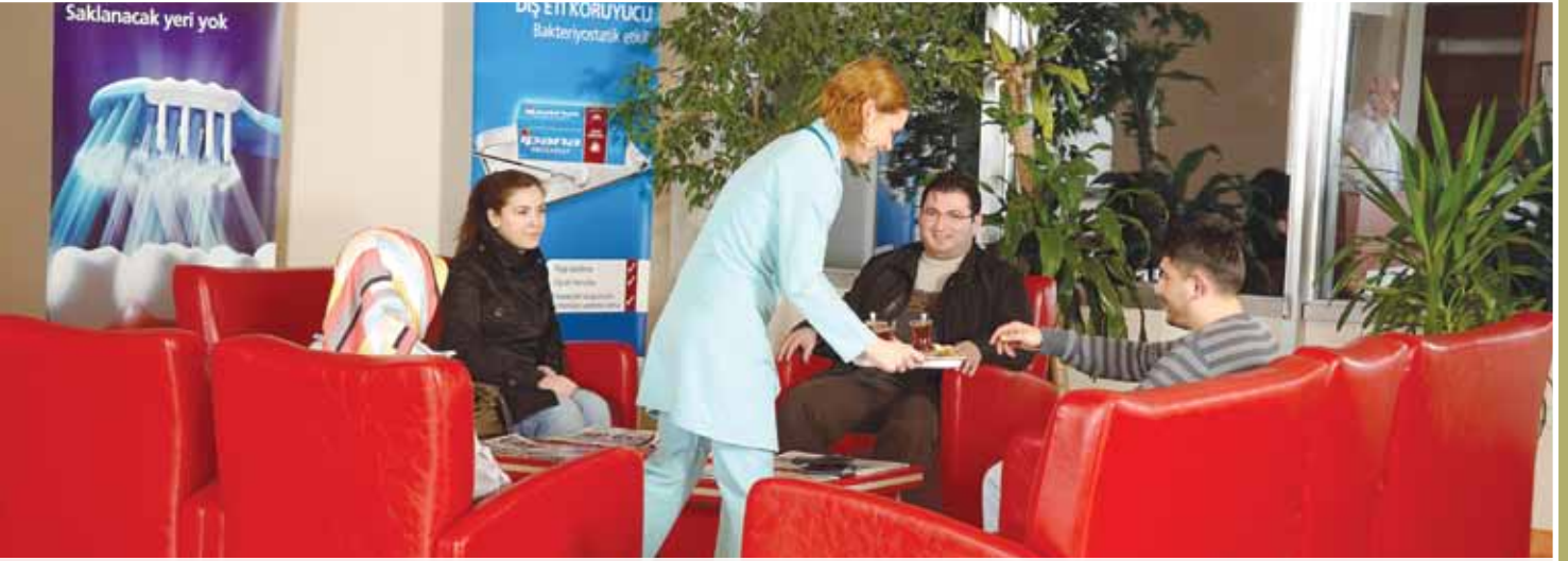
Konforlu ve Gülelyüzlü Hizmet