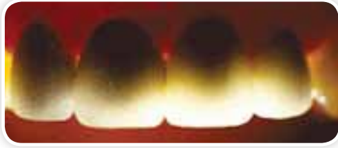
Metal destekli porselen kuron görüntüsü (Güneş ışığında doğal diş görüntüsü vermez)

Diş kaybı olmayan, aşırı harabiyeti olan yada laminate kuron yaklaşımının yetersiz kalabileceği durumlarda empres yada zirkonyum kuron yapılabilir. Ancak diş kaybının söz konusu olduğu durumlarda ise sadece zirkonyum kuronlar tercih edilmelidir.